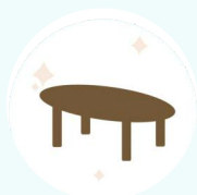
Очищайте поверхности, к которым часто