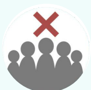
Избегайте мест скопления людей