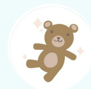
Регулярно мойте игрушки