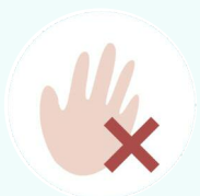
Избегайте контактов с больными людьми