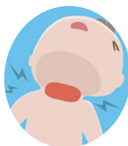
Боль в горле