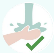
Регулярно мойте и дезинфицируйте руки