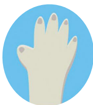
Синеватый оттенок кожи