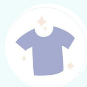
Соблюдайте личную гигиену прикасается